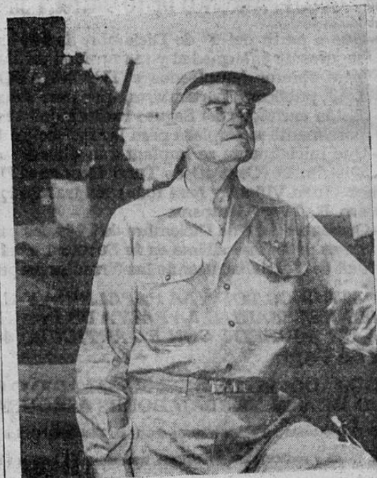
El Almirante William F. Halsey, Comandante de la Tercera Escuadra de la Armada de los Estados Unidos, a bordo de un barco de guerra en aguas del Pacífico durante la gran batalla naval de las Filipinas en que fueron destruidos o averiados 58 buques de guerra japoneses.