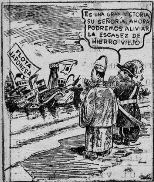
Harper en el Birmingham News.

LA SUCURSAL DE LIMON SERA ESTABLECIDA EN EL EDIFICIO DE LA UNIDAD SANITARIA.