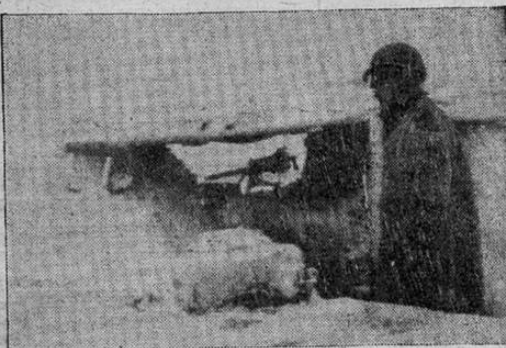
La primera nevada del invierno cubre las posiciones de la línea de batalla en Alemania, donde los soldados estadounidenses continúan avanzando dentro del territorio del Reich. Un artillero contempla la tormenta. (Radiofoto transmitida de Londres a Washington.)